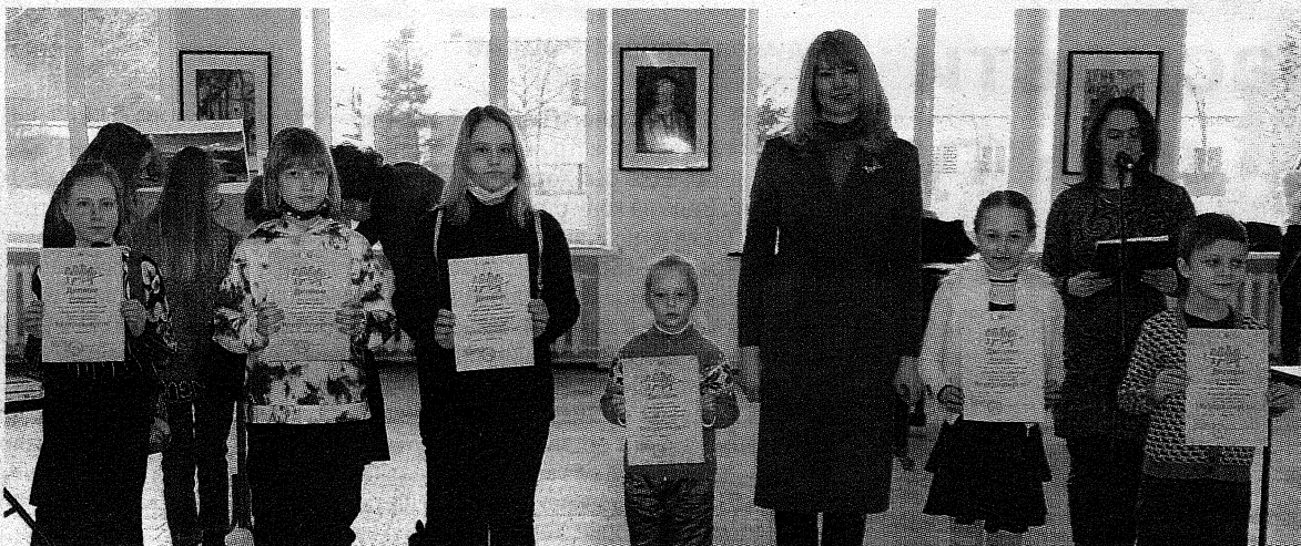
Лауреаты конкурса «Рождественские мотивы»