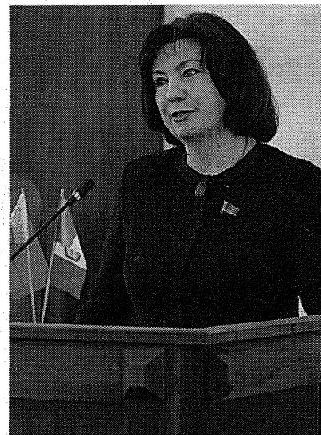
По словам Н. Кочановой, встреча проходила в доброжелательной атмосфере