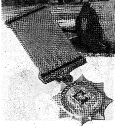
Впервые вручение областной премии состоялось в Полоцке