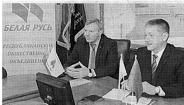
Успех – во взаимодействии