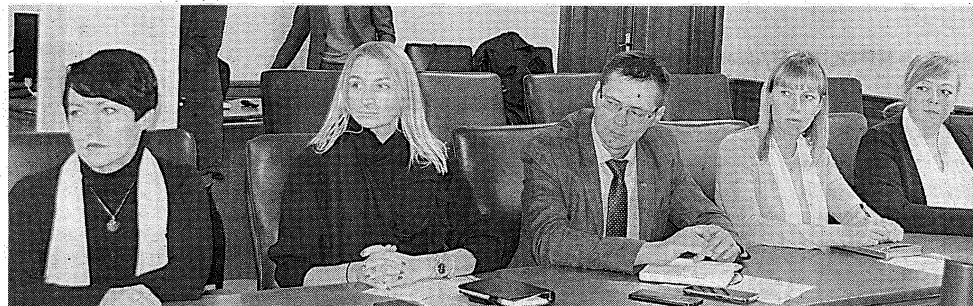
Обучающие курсы пройдут во всех регионах страны