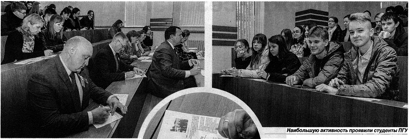
Участие в диктанте принял и глава города

Новополочане присоединились к международной просветительско-патриотической акции «Диктант Победы», предложенной организацией «БРСМ». Местом проведения стал Полоцкий госуниверситет им. Евфросинии Полоцкой.