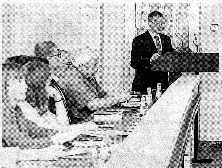
В Полоцком госуниверситете противодействию коррупции уделяется большое внимание

рассматриваются вопросы о предупреждении данных правонарушений, устранении причин и условий, способствующих их совершению в учреждении образования. В том числе проводится обширная правовая работа по недопущению фактов экстремизма, мошенничества, хищения имущества путем модификации компьютерной информации, незаконного оборота наркотиков.