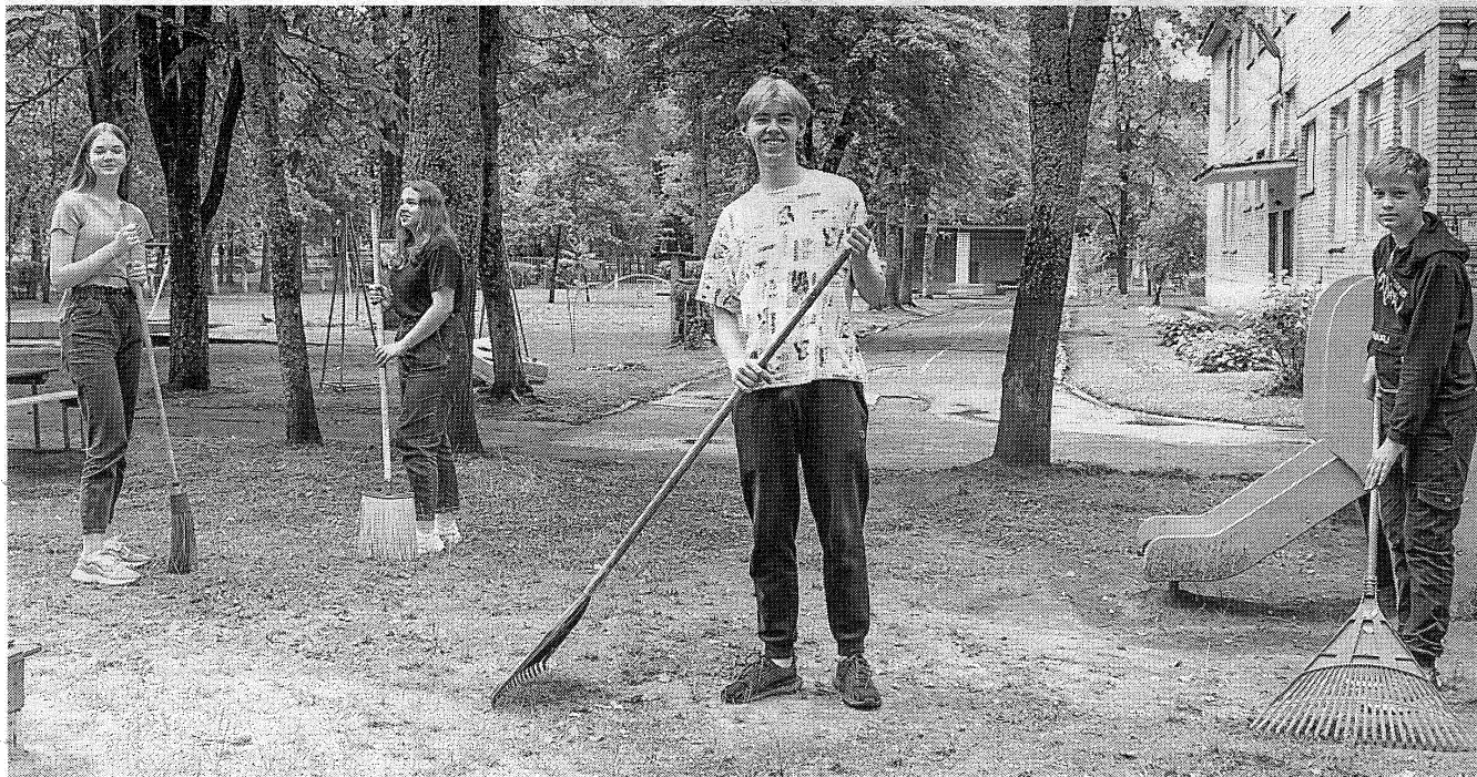
Союз молодежи предоставляет новополоцким школьникам возможность заработать собственные деньги в период с июня по август