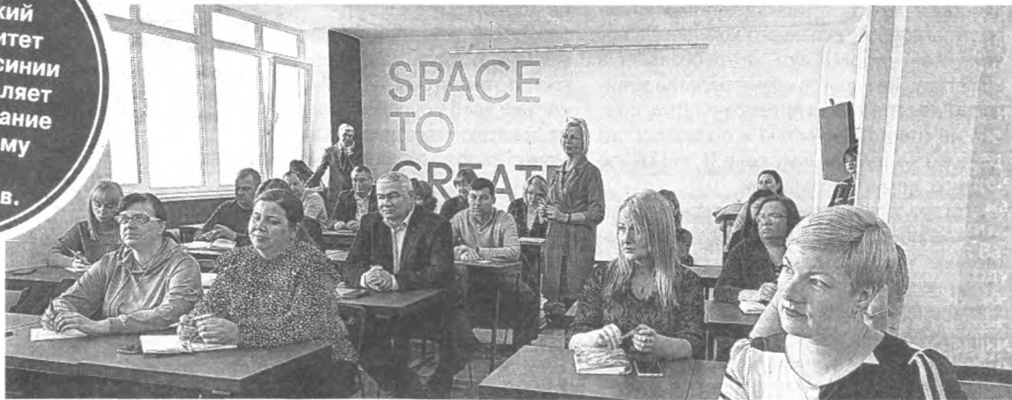
Порядка 30 представителей предприятий, организаций и учреждений города вновь вернулись за парты, на неделю став студентами

Уже не первый год Полоцкий госуниверситет имени Евфросинии Полоцкой уделяет большое внимание всестороннему развитию специалистов.