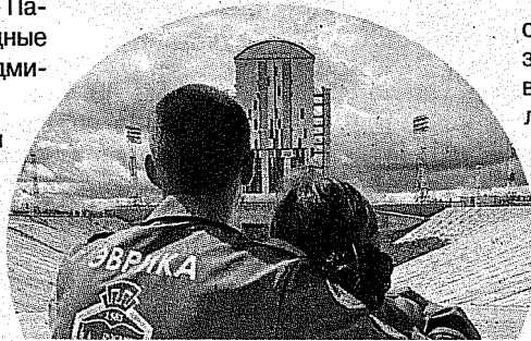
Стройотряд – это романтика