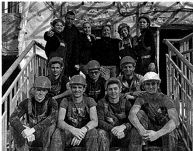
Дружба в «Эврике» крепче стали и прочнее бетона!

Высокая оценка вложенных сил всегда мотивирует. Да, не все давалось легко. Но я благодарна Новополоцку за подаренные возможности проявить себя.