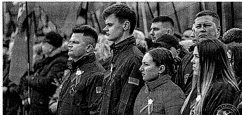
Новополочанка с лидерами ОО «БРСМ»

– Нужно не бояться отстаивать интересы своих товарищей, коллектива. Есть такая книга «Лидеры едят по-