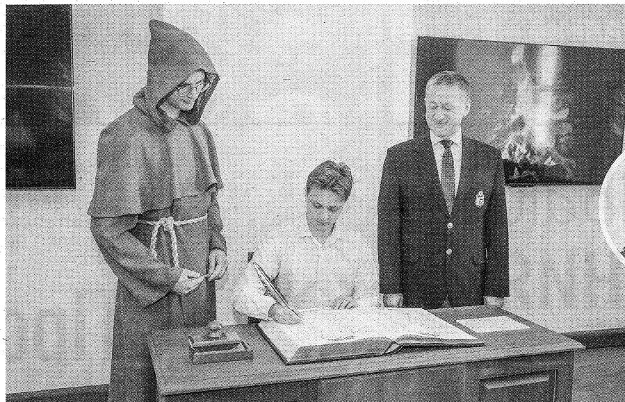
Во время церемонии внесения памятной записи в почетную книгу.