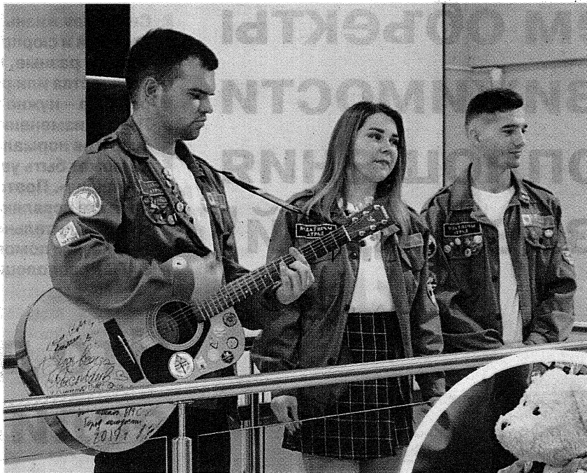
Вместе веселее с песней!

Лето – это не только пора отпусков и дачных хлопот, но и самое подходящее время для работы в студенческих отрядах. Ежегодно парни и девушки из разных регионов страны принимают участие в строительстве социальных объектов в нашей республике и за ее пределами. Для молодых ребят это отличная возможность обрести новую профессию, найти настоящих друзей и ощутить себя частью огромной семьи.