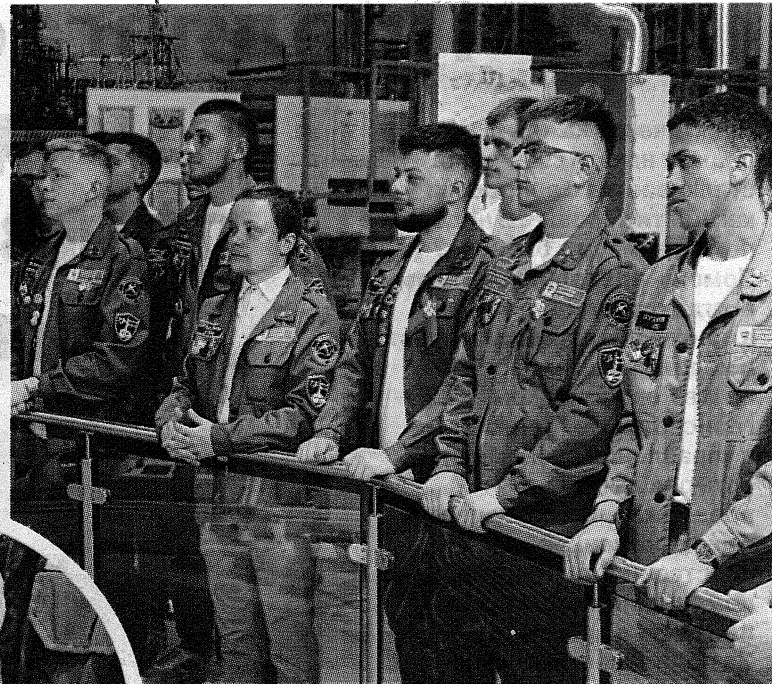
Представители студотрядов ПГУ