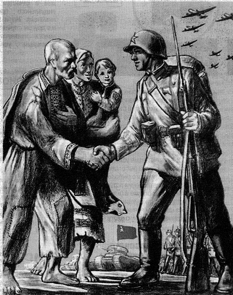
Малюнак з сайта 3.com.pl

Эканоміка заходнебеларускіх зямель падчас знаходжання ў складзе польскай дзяржавы насіла пераважна аграрны характар. Больш як 90% насельніцтва краю займалася сельскай гаспадаркай. У выніку