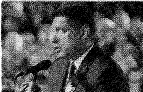
ФОТО АЛЕКСАНДРА ЛУКАШЕНКО

— О том, что в новом проекте Конституции предполагается ограничить количество сроков президентских полномочий двумя. Можно ли услышать ваше мнение относительно этой нормы? Как вы лично к ней относитесь?