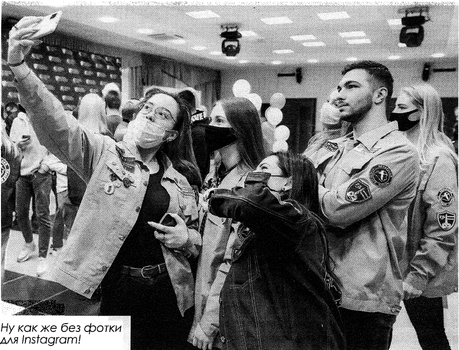
Ну как же без фотки для Instagram!

— Своим трудом вы вносите большой вклад в развитие промышленного, строительного, аграрного, транспортного комплексов, приносите пользу своему поселку, городу и стране в целом. Участие в строительных студенческих отрядах дает вам уникальную возможность для реализации своих сил и талантов.