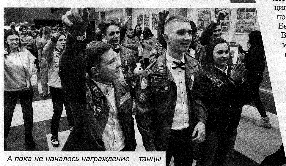
А пока не началось награждение – танцы