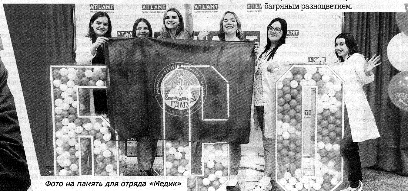
Фото на память для отряда «Медик»