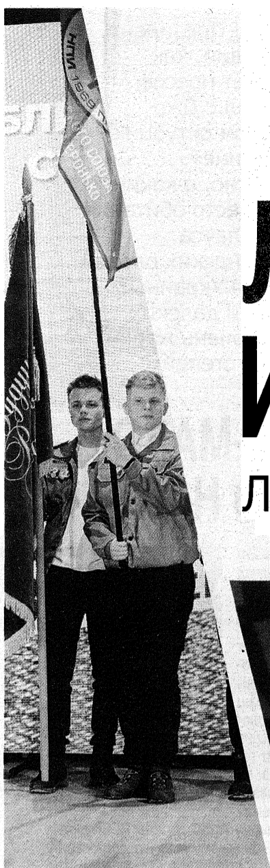
Переходящее знамя – у «Эврики»