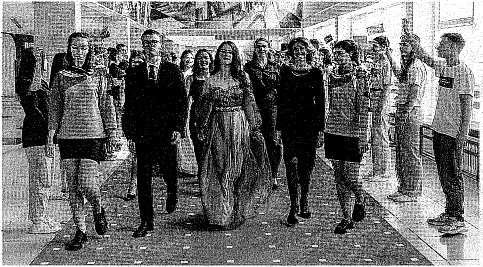
Открывало мероприятие традиционное шествие по красной ковровой дорожке