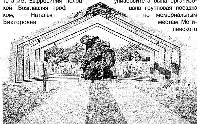
Трагические страницы истории нашей страны навсегда застыли в бронзе и граните

Со времени своего зарождения профсоюзы занимались очень важным сегментом, касающимся полноценного отдыха сотрудников, а также поддерживали корпоративный дух своих организаций и учреждениях. В преддверии 80-летия освобождения Беларуси от немецко-фашистских захватчиков для профсоюзного актива университета была организована групповая поездка по мемориальным местам Могилевского